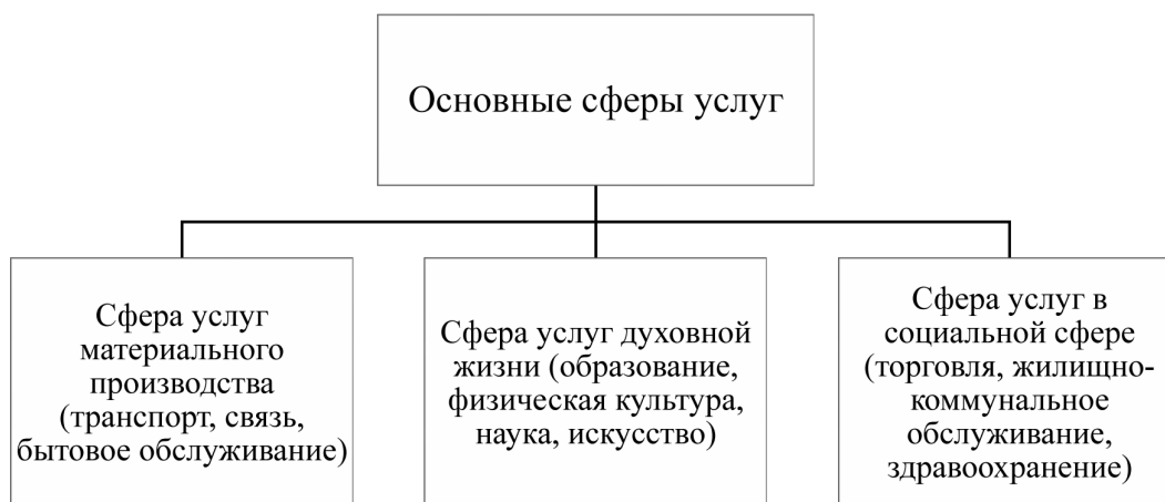
Рисунок 3 – Состав сферы услуг (составлено автором)

ных принципов такой модели – доступ к пользованию, а не владению каким-то благом: у одних людей есть ресурс или его избыток, который нужен другим (инструменты, оборудование, автомобиль, жилье, навыки и умения, информация, свободное время). На этой почве вырастает большое число конкретных сервисов, которые соединяют тех, кто владеет ресурсом с теми, кто в нем нуждается.