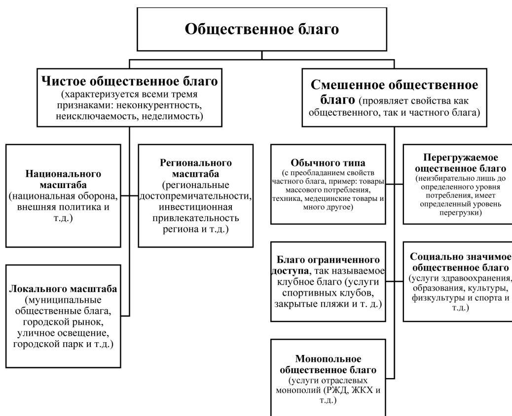
Рисунок 1 – Классификация общественных благ (составлено автором)

ганизации не всегда заинтересованы в их производстве в силу отсутствия какой-либо коммерческой выгоды. Например, в небольшом населенном пункте нет магазина, который, безусловно, необходим местным жителям, но частный предприниматель не заинтересован открывать магазин в данном городе из-за малого объема рынка или низкой платежеспособности местного населения. В этом случае органы местного самоуправления, используя экономические рычаги, должны создать для такого предпринимателя все необходимые условия, например, предоставить помещение на льготных условиях или субсидировать оплату жилищно-коммунальных услуг с целью обеспечения населения всеми необходимыми благами для его нормальной жизнедеятельности.