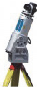
Лазерный сканер RIEGL LMS-Z390i Дальность: от 1 до 400 м. Скорость сканирования: до 11 000 точек/сек. Точность измерений: 2–4 мм

Лазерный сканер может выполнять съемку объектов, находящихся в любом месте сферы – полный круг по горизонтали ( 360^\circ ) и 270^\circ по вертикали (рис. 3). Такое широкое поле зрения лазерного 3D-сканера позволяет минимизировать число станций сканирования. Точность безотражательного дальномера наземного лазерного сканера составляет в среднем 4 мм. При этом точность положения каждой измеренной точки по трем осям ( X, Y, Z ) – не ниже 6 мм при расстоянии до объекта 50 метров и менее.