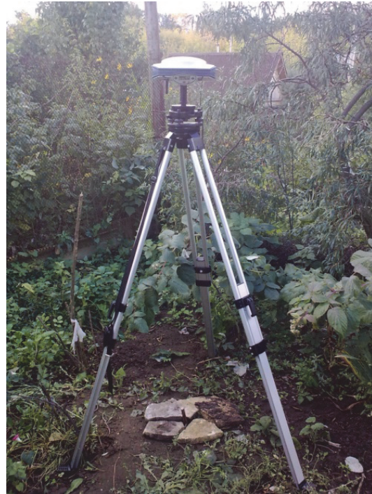
Рис. 5. Базовая станция

На пункте, который находится на поверхности Земли, производят радиодальномерные наблюдения синхронно не менее 4 спутников. Радиосигнал, используемый для измерения расстояния, содержит информацию об элементах орбиты наблюдаемого спутника. На основании основного уравнения космической геодезии (1) имеем \rho_s = r_s - r_{PS} , где S = 4 , а P = 1 . Этот метод реализуют глобальные навигационные спутниковые системы (ГНСС).