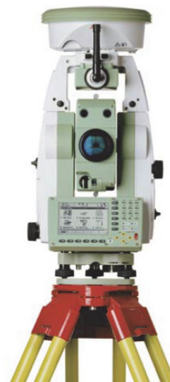
Рис. 6. Комбинированный прибор SmartStation

Данные выводятся на экран прибора и сохраняются в едином формате. SmartStation устанавливается на один штатив и всего на 1 кг тяжелее обычного тахеометра. Обмен данными с внешними устройствами выполняется с использованием встроенного модуля беспроводной связи Bluetooth. Опыт показывает, что новая система позволяет