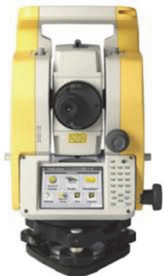
Рис. 2. Электронный тахеометр CADSPN6L

Применение электронных тахеометров в строительстве позволяет существенно облегчить выполнение ряда специальных работ, таких как определение координат и высот точек местности, планирование строительного участка, закладка фундамента, монтаж конструкций, возведение панельных зданий, вынос в натуру проектных решений, съемка фасадов зданий и т. д. Электронным тахеометром можно производить измерения полярных и прямоугольных координат, высотных отметок (рис. 2).