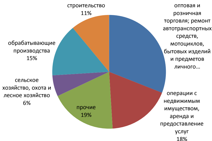
Рис. 1. Распределение малых предприятий Архангельской области по видам экономической деятельности [3]

[5]. Законом определяются общие направления и принципы организации поддержки малого и среднего предпринимательства.