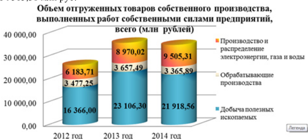
Рисунок 3 – Объем отгруженных товаров собственного производства, выполненных работ собственными силами

Объем отгруженных товаров собственного производства, выполненных работ собственными силами предприятия по виду деятельности добыча полезных ископаемых составил 21918,56 млн руб., или 94,86 % от уровня соответствующего периода прошлого года. Объем обрабатывающего производства составил 3365,89 млн руб., или 92,03 % от объема 12 месяцев 2013 года. Производство и распределение электроэнергии, газа и воды в 2014 года в сравнении с прошлым годом увеличилось на 5,97 % и составило 9505,31 млн руб.