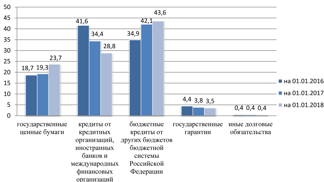
Рисунок 2 – Структура государственного долга субъектов РФ, % (составлено автором по данным единого портала бюджетной системы РФ «Электронный бюджет» [4])

Проводимая государственная политика, нацеленная на замещение дорогостоящих рыночных долговых обязательств бюджетными кредитами, заметна при рассмотрении структуры государственного долга субъектов РФ (рисунок 2). Объём снижения кредитов от кредитных организаций, иностранных банков и международных финансовых организаций и государственных гарантий за последние два года равен объёму роста бюджетных кредитов от других бюджетов бюджетной системы Российской Федерации и составляет 13,7 п.п. Уровень иных обязательств в структуре государственного долга не изменился.