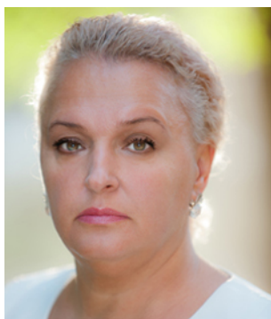
В. В. Яровая

Ключевые слова: «стольпинская» реформа, аграрно-крестьянский вопрос, переоценка исторических ценностей, аграрные предприятия, социальная ответственность предприятий, занятость, заработная плата, социальная инфраструктура.