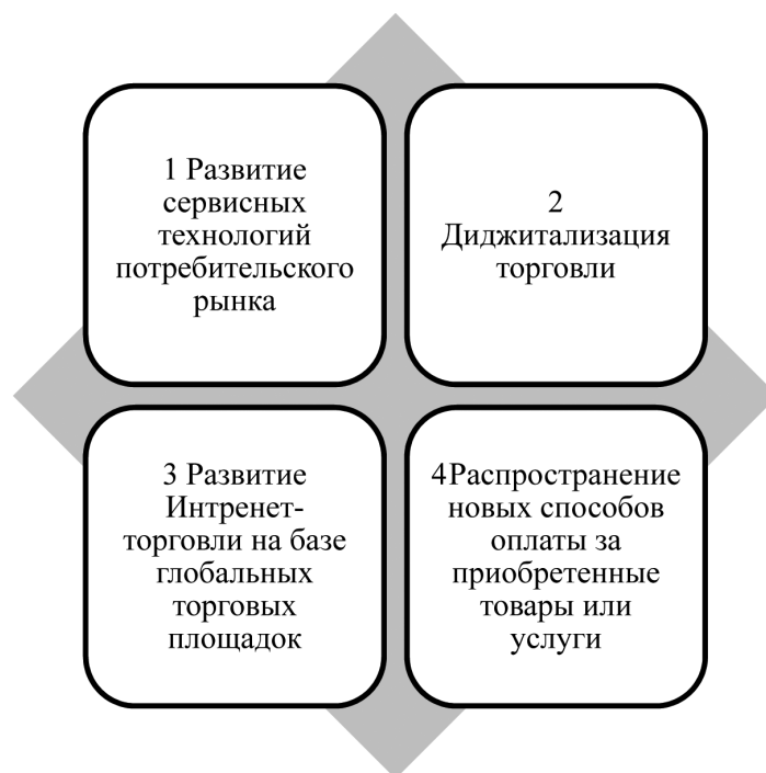
Рисунок 3 – Ключевые тренды на мировом уровне (составлено авторами)

Ключевые тренды, угрозы и возможности на мировом уровне отражены на рисунке 3.