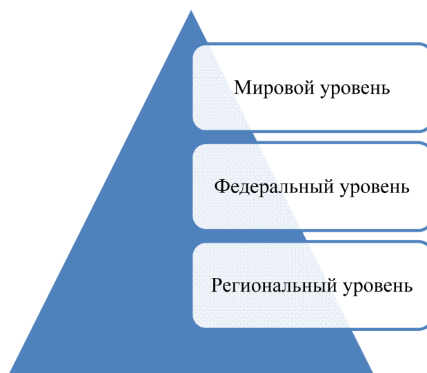
Рисунок 2 – Уровни исследования трендов, угроз и возможностей (составлено авторами)

Ключевые тренды, угрозы и возможности по функционированию и развитию потребительского рынка и сферы услуг города Ростова-на-Дону нами определены по трем основным уровням (рисунок 2).