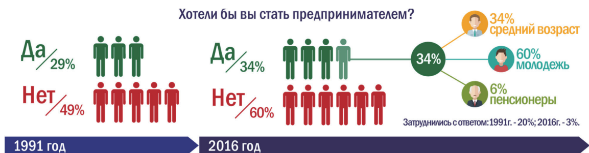
Рисунок 1 – Готовность граждан Российской Федерации стать предпринимателем

Развитие предпринимательства связано еще и с социальным аспектом, затрагивающим вопрос формирования среднего класса в структуре общества государства, что также усиливает значимость развития предпринимательства на территории Российской Федерации. Совершенно справедливо стоит заметить, что на сегодняшний день российское общество является недостаточно готовым к более активному самостоятельному экономическому хозяйствованию, что подтверждается статистическими исследованиями, представленными на рисунке 1 1 .