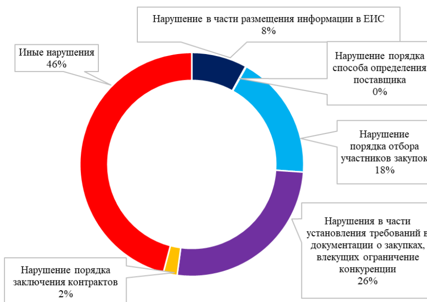
Рисунок 1 – Структура основных нарушений заказчиков в контрактной системе (составлено авторами по данным Федеральной антимонопольной службы [Электронный ресурс]. – URL: https://www.fas.gov.ru/spheres/5 (дата обращения: 25.11.2019)

Данные таблицы указывают на рост количества административных правонарушений среди региональных и муниципальных заказчиков, однако объем наложенных административных штрафов снижается.