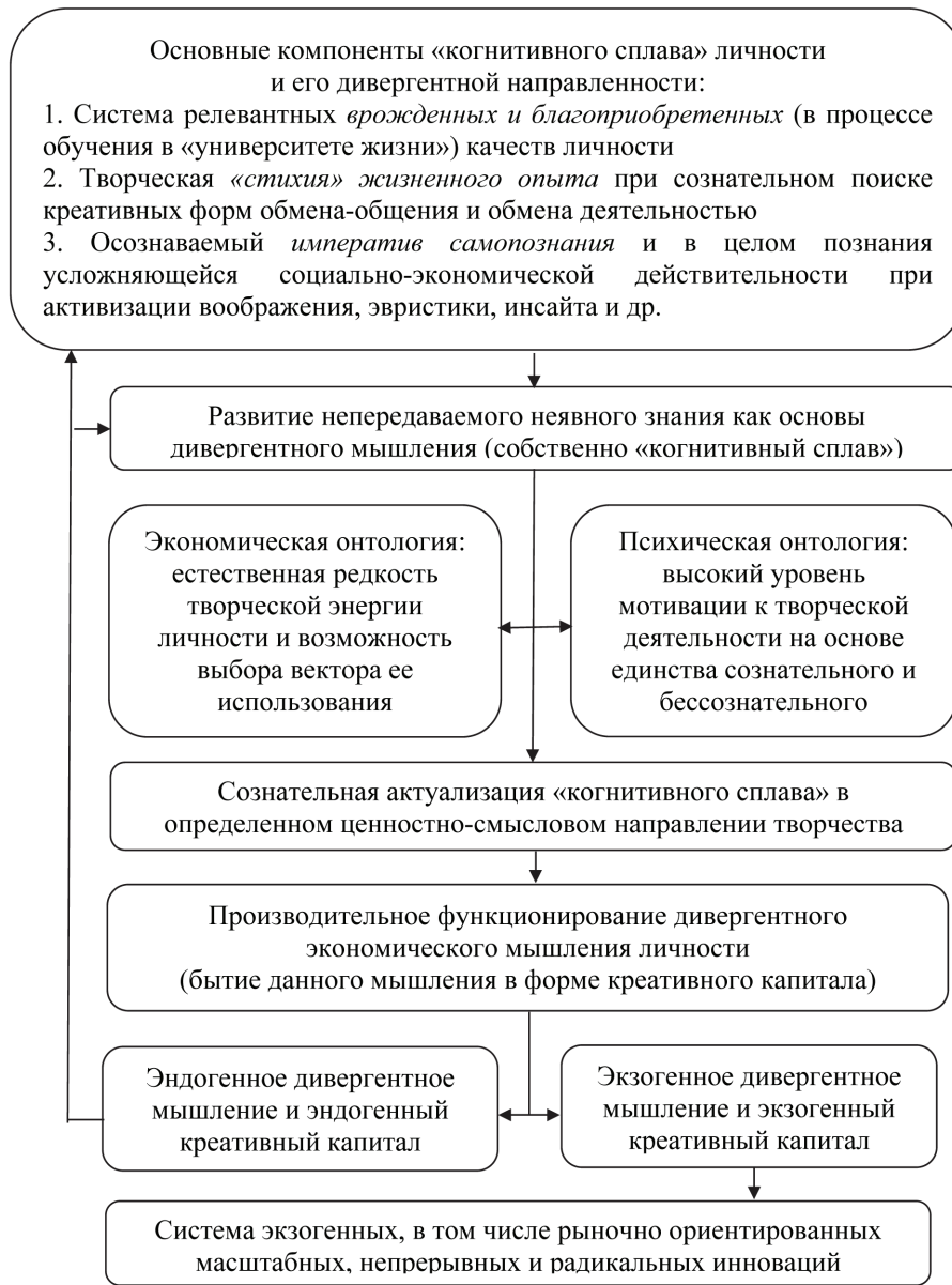
Рисунок 3 – Источники и назначение дивергентного мышления личности в условиях нарастания сложности 10

творчески-трудовой деятельности. При этом культ гуманизма и творческого созидания нацеливает данное мышление на расширенное воссоздание идей, знаний, технологий и продуктов, на деле способствующих формированию и развитию жизни, достойной реализации сущностных сил личности.