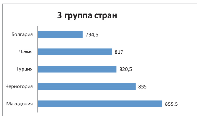
Рис. 3. Объемы товарооборота Сербии со странами 3-й группы, млн долл. США, 2014 г.

Ко второй группе стран по структуре товарооборота Сербии с Европой относятся страны с показателем объема товарооборота от 900 до 1400 млн долл. США (рис. 2). В основном это небольшие страны восточной Европы, с которыми Сербия стремится сохранить долгосрочные торговые отношения. Страны второй группы занимают долю в 21% по отношению к остальным странам Европы и показывают положительную динамику роста. Со всеми странами ведется активная торговля товарами и услугами.