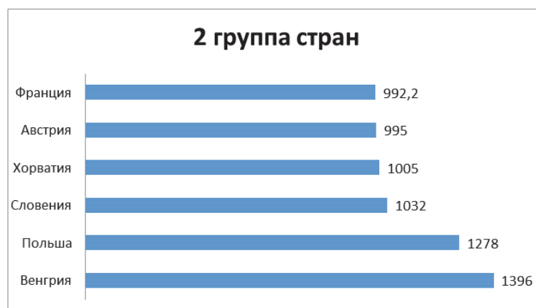
Рис. 2. Объемы товарооборота Сербии со странами 2-й группы, млн долл. США, 2014 г.

Лидирующее место по объемам товарооборота Сербии с большим отрывом занимают: Италия (13,8%), Германия (11,9%) и Россия (10%).