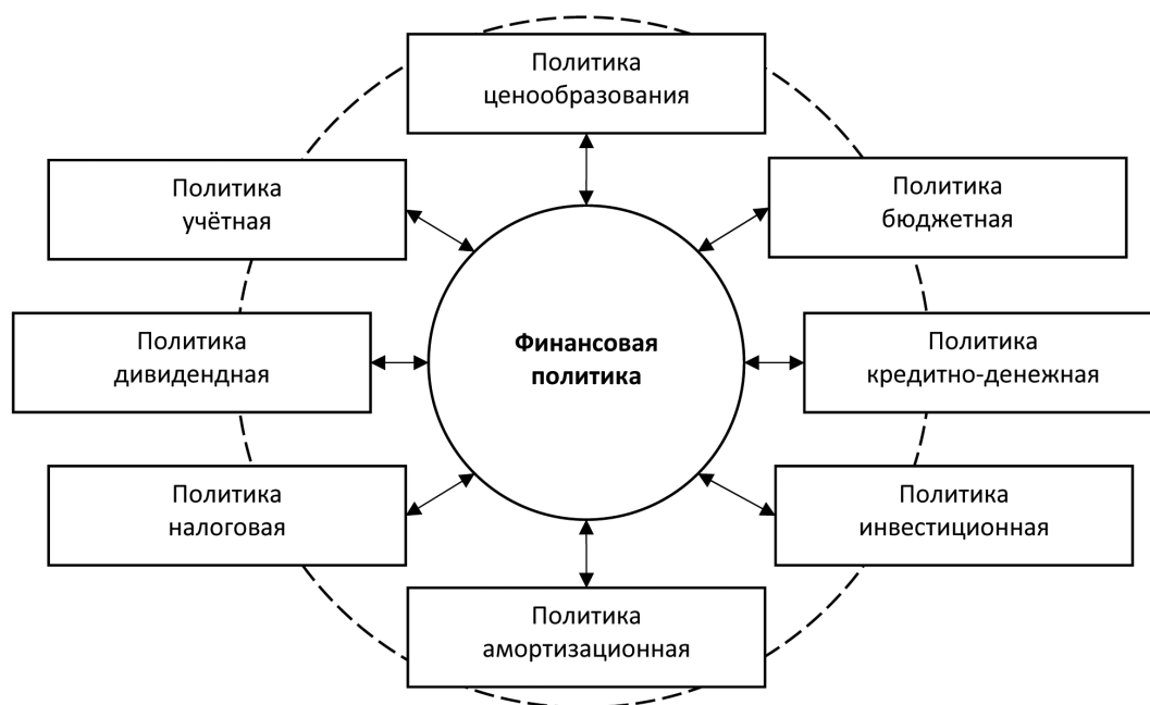
Рисунок 1 – Система составляющих финансовой политики ПАО «Аэрофлот»

Для того чтобы определить, что именно нужно усовершенствовать в деятельности компании относительно финансовой политики, в первую очередь, следует обратить внимание на основные финансовые показатели организации [2]. Следует отметить высокую ликвидность деятельности ПАО «Аэрофлот». Низкое соотношение денежных средств к выручке «Аэрофлота», составляющее около 10 %, по сравнению со средним мировым показателем около 20 %, компенсируется доступными кредитными линиями и ожидаемым положительным свободным денежным потоком (FCF). На конец 2018 года его денежные средства и краткосрочные депозиты составляли 30 млрд руб., которые вместе с доступными кредитными линиями в размере 84 млрд руб. обеспечивали достаточное покрытие краткосрочных долговых обязательств в размере 15 млрд руб. Группа компаний «Аэрофлот» не платит комиссионные за обязательства по своим кредитным линиям, но, учитывая ее государственную собственность, мы ожидаем, что средства от банков будут доступны в случае необходимости. Стоит ожидать, что «Аэрофлот» будет генерировать положительный FCF в течение 2019–2022 годов на фоне улучшения операционной деятельности и умеренных капиталовложений.