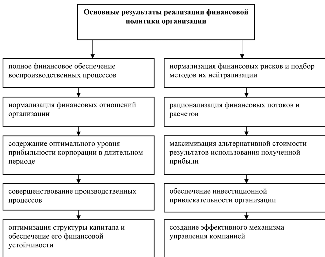
Рисунок 3 – Результаты реализации финансовой политики организации (разработано автором)

Для того чтобы оптимизировать собственную финансовую политику, предприятие должно понимать, к чему оно движется и какие основные цели ставит, разрабатывая ее. Поэтому перед реализацией политики необходимо установить результаты этого процесса. Основные результаты реализации финансовой политики компании представлены на рисунке 3.