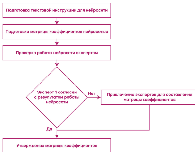
Рисунок 2 – Процедура экспертной оценки взаимосвязи содержательной части учебных тем для оптимизации ИОМ