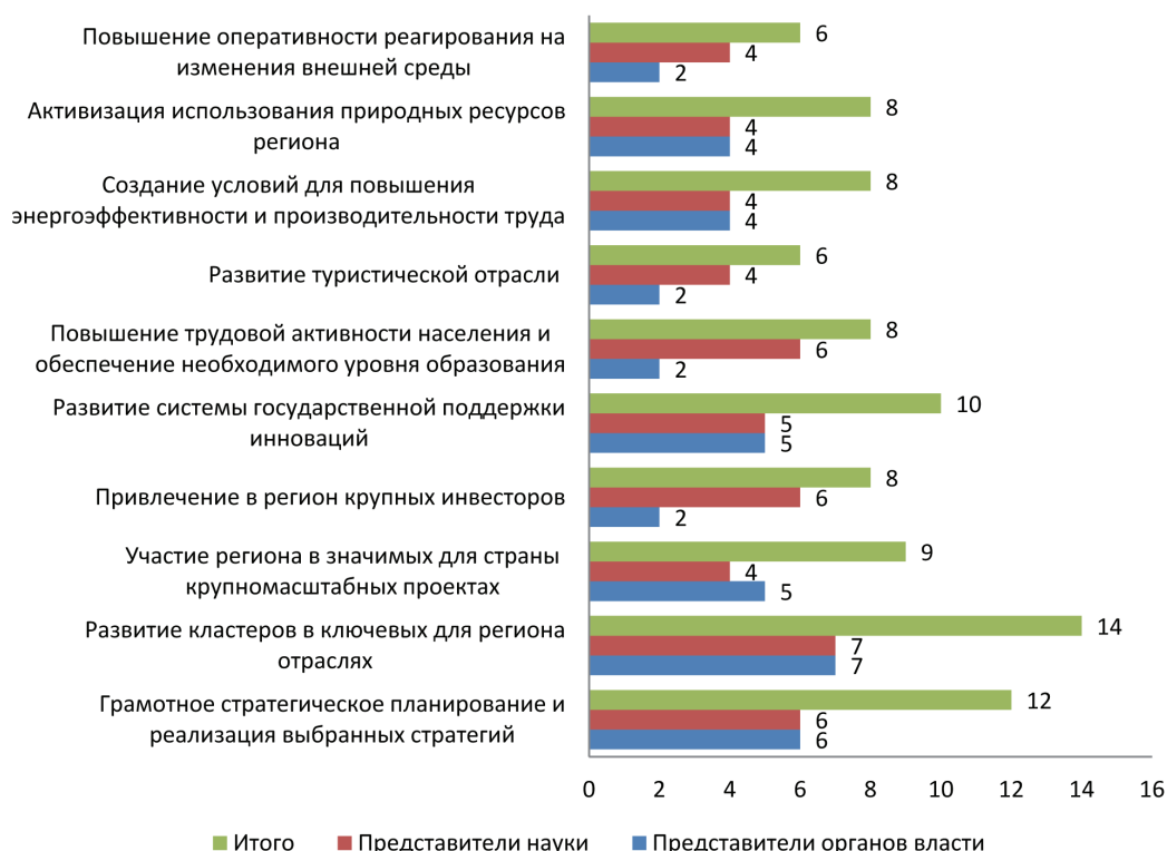
Рисунок 1 – Приоритетные направления развития Пензенской области с точки зрения экспертов 1

Анализ результатов экспертного опроса позволил определить приоритетные направления развития Пензенской области. Так, эксперты к числу наиболее значимых направлений отнесли: создание кластеров в ключевых отраслях (70 %), грамотное стратегическое планирование (60 %), развитие системы государственной поддержки инноваций (50 %) (рисунок 1).