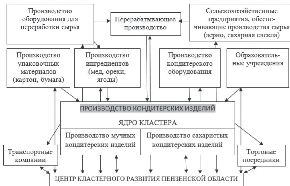
Рисунок 3 – Предлагаемая структура кондитерского кластера Пензенской области 3

Поэтому структура кондитерского кластера Пензенской области может быть усовершенствована и может приобрести следующий вид (рисунок 3).