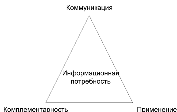
Рисунок 2 – Тринитарная модель информационной потребности Менцеля

Менцель анализирует информационную потребность с трех точек зрения, что приводит его к построению тринитарной системы [19; 20] или тринитарной модели (рисунок 2). Поскольку его исследования связаны, в первую очередь, с поиском в библиотечном фонде, то расширим его подход к более широкому поиску и более широкому понятию информационной потребности. Это дает основание ввести расширенную интерпретацию трех аспектов информационной потребности в информационном поле.