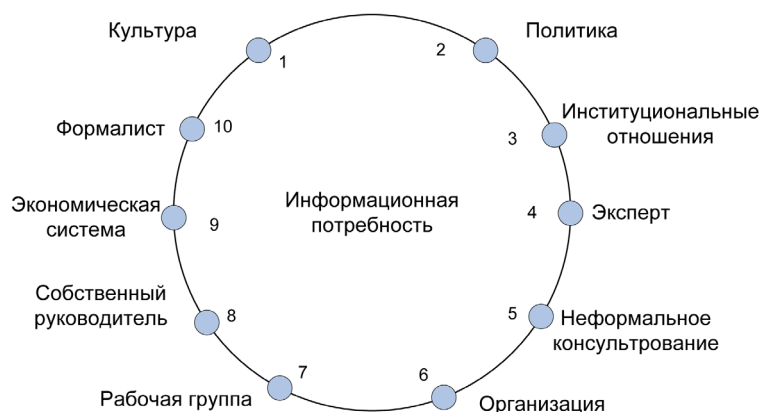
Рисунок 3 – Концентрическая модель У. Дж. Пейсли

Уильям Дж. Пейсли рассматривает в качестве основного пользователя информации ученого, и его потребность является основной и самой полной. На окружности находятся десять факторов, которые мы, применительно к современной ситуации, интерпретируем следующим образом.