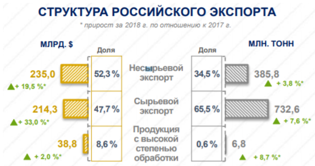
Рисунок 3 – Структура российского экспорта за 2018 гг. 6

Как показано на рисунке 3, в товарной структуре экспорта продолжают преобладать топливно-энергетические товары, их доля в 2018 году увеличилась по сравнению с 2017 годом на 4,5 п.п. до 63,8 %. Несырьевой экспорт в 2018 году увеличился на 19,5 % по отношению к 2017 году и составил $235,0 млрд, при этом прирост несырьевого неэнергетического экспорта составил 11,7 % до $149,3 млрд, инновационных товаров – 3,8 % до $30,1 млрд. Экспорт машинно-технической продукции увеличился на 2,7 % до $29,1 млрд 5 .