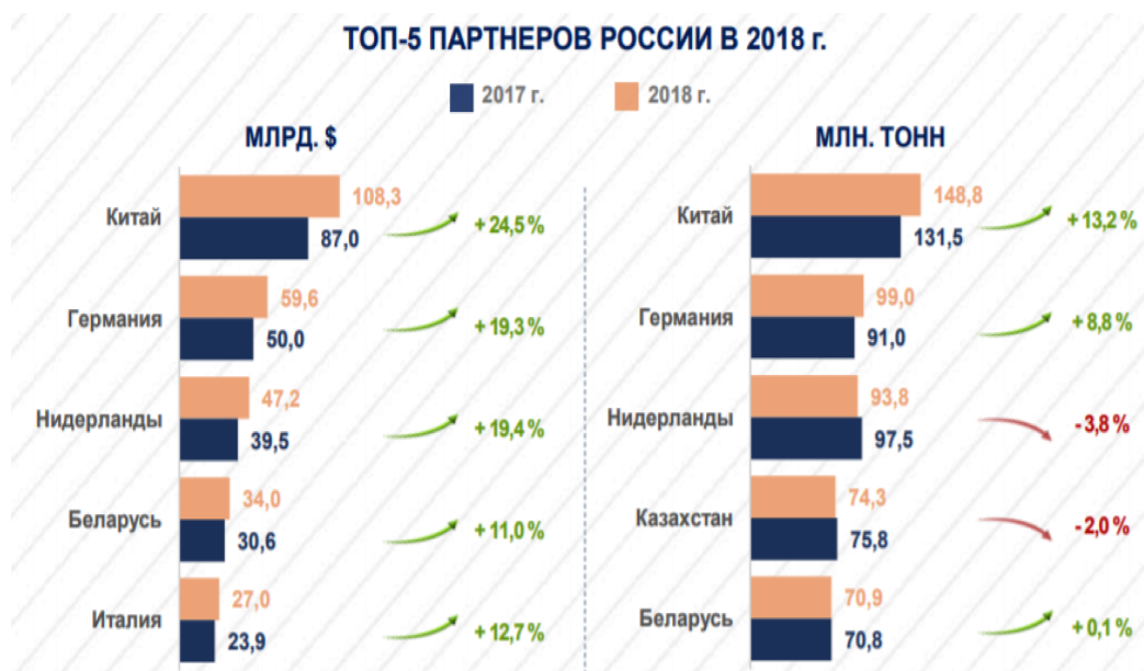
Рисунок 4 – Основные партнеры России в 2018 г. 8

Помимо положительной динамики международного таможенного сотрудничества и внешнеэкономической деятельности в целом, следует отметить некоторые проблемы участников ВЭД: