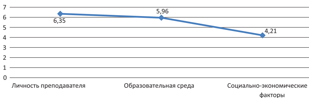
Рисунок 2 – Факторы успешности профессиональной деятельности будущих юристов (1–4-й курсы)

Соответственно выявлялись факторы, определяющие успешность профессиональной деятельности будущих юристов (рисунок 2): личность преподавателя (средний балл 6,35), привлекательность участия в студенческой жизни, возможность общения с большим кругом интересных людей, в том числе с юристами-профессионалами, проявление творчества (средний балл 5,96), гарантия трудоустройства, стабильная заработная плата, престиж профессии (средний балл 4,21).