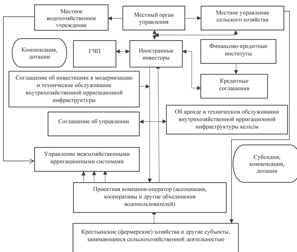
Рисунок 2 – Организационно-экономические меры, направленные на повышение эффективности орошаемых сельскохозяйственных земель 5