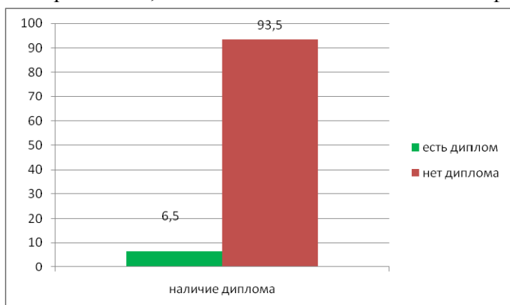
Рис. 3. Процент менеджеров, имеющих хотя бы свидетельство о повышении квалификации в организациях, руководители которых не удовлетворены уровнем менеджмента

Для оценки того, есть ли понимание у менеджеров, не имеющих соответствующего образования, необходимости повышения квалификации, были использованы результаты их ответов на пятый вопрос анкет. Этот вопрос содержал таблицу, в которой перечислены основные темы в области менеджмента и социального проектирования.