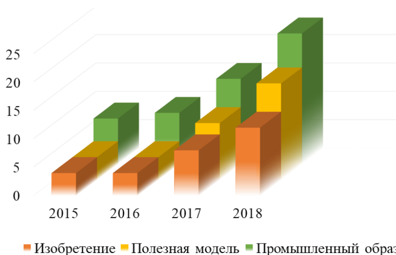
Рисунок 2 – Количество вынесенных судебных решений по взысканию компенсации за нарушение прав патентных объектов

Стратегия ведения судебных споров о защите прав владельцев патентов на изобретение или полезную модель хоть и подчиняется общим правилам, но имеет свои особенности.