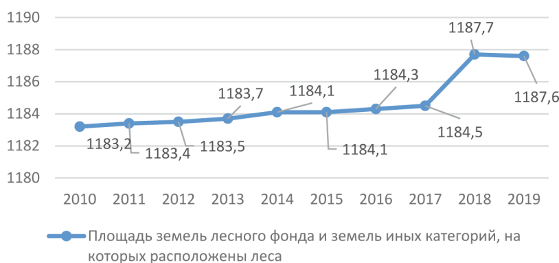
Рисунок 1 – Площадь земель лесного фонда и земель иных категорий, на которых расположены леса (составлено авторами по данным сборника Росстата 2016 и 2020 гг. «Охрана окружающей среды в России»)

В области защиты лесов с 2010 по 2019 год мы видим следующую тенденцию (рисунки 1, 2).